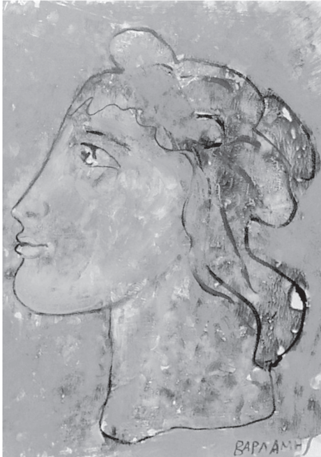
Ε. Βαρλάμη: Σχέδιο σε χαρτί, 1994