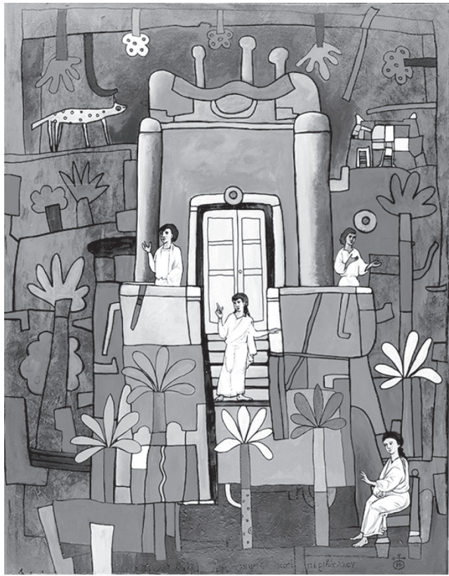
συλλογή: «Αποκάλυψη και Περιβάλλον», 1995