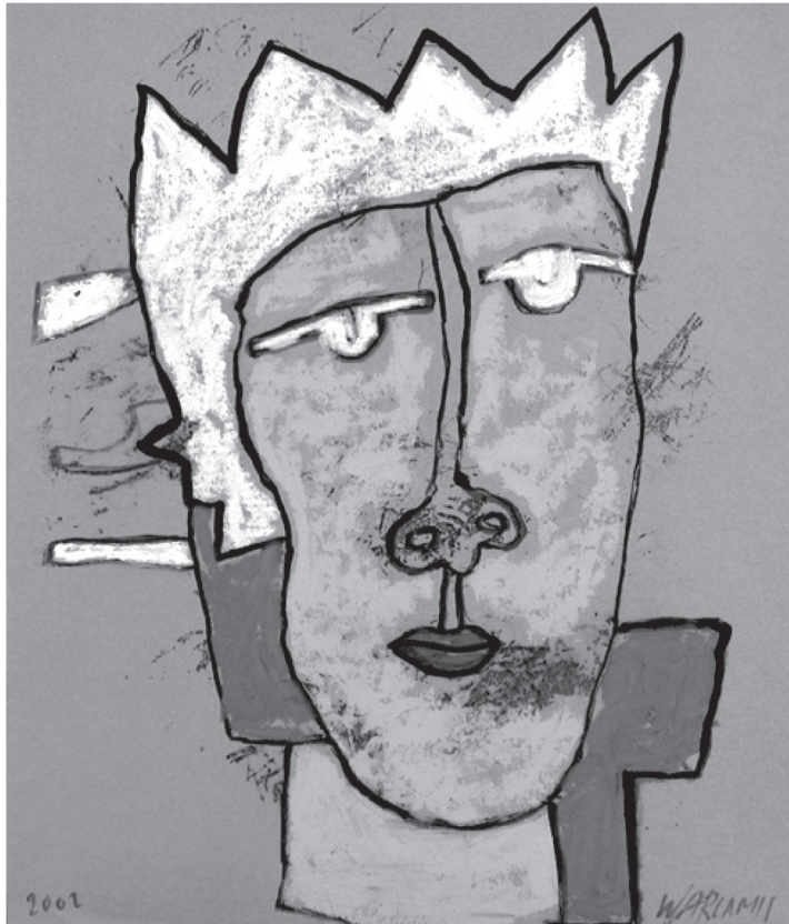
Ε. Βαρλάμη: Σχέδιο σε χαρτί, 2001