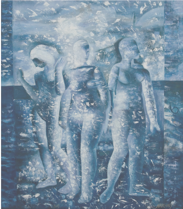
συλλογή: «Μότσαρτ - Ο Μυστικός Κήπος» -2005