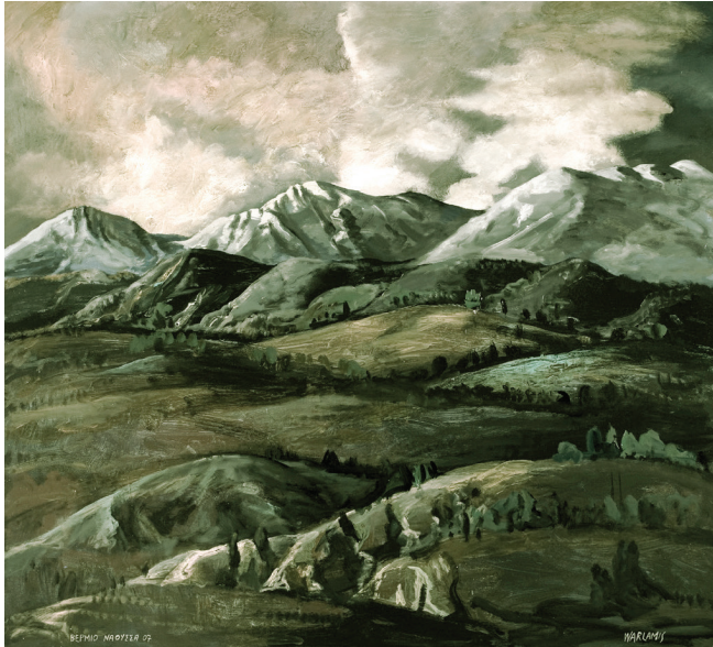
συλλογή: «Τα Βουνά της Πατρίδας μου», Βέρμιο, 1980