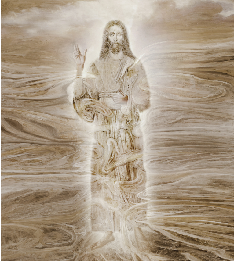
συλλογή: «Ο Χριστός Σήμερα», 2010