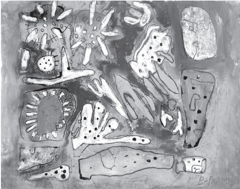
Ε. Βαρλάμη: Σχέδιο σε χαρτί, 2001